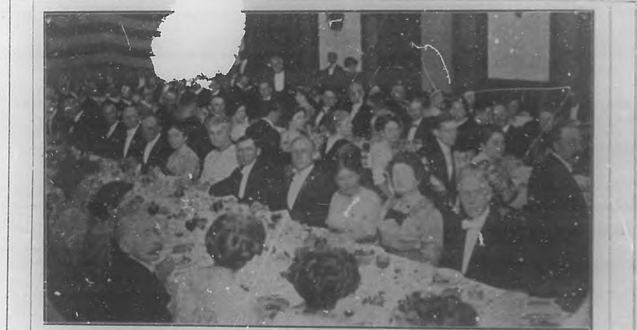
Aspecto de la mesa durante el banquete con que el Ayuntamiento obsequió á los turistas de Chattanooga que visitaron la Habana. Banquet given by the Municipality of Havana in honor of the Chattanooga tourists.

After the applause was over, Mr. Bradt responded briefly to the calls for a speech. "I am glad I am a citizen of the United States. I am glad