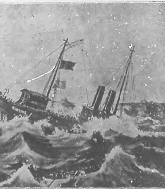
Naufragio del Hawkins

A las seis de la mañana del día 27, sólo se veía en derredor del Hawkins la espesa niebla con que se preña la atmósfera de aquellas regiones en el crudo invierno, y reinaba un silencio horrible interrumpido por el rugir de las olas, el silbo del viento, ó la voz de algún patriota que pedía otro tabaco para fumar, ó alguno que entonaba algún pedazo de la Marsellesa inmortal al tomar turno en el trabajo.