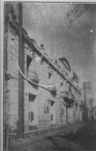
CAMAGÜEY.—Vista del Ayuntamiento.

Pero entendemos como decimos antes que es de una modestia extrema lo cual le quita interés.