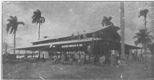
CAMAGÜEY.—Pabellones en construcción para la Exposición, donde se pondrán las labores de la mujer y objetos de arte en general. El taller de chicle que queda detrás es para las Esuelas Públicas.

resonancia, en la capital de la República. ¡Ese sería el camino! Gracias a la actividad de nuestro agente corresponsal de BOHEMIA con varias vistas fotográficas de parte de la Exposición y de las autoridades y personalidades que han prolijado y dado forma al exponente de actividad, cultura y progreso que representa la Exposición de Camagüey.