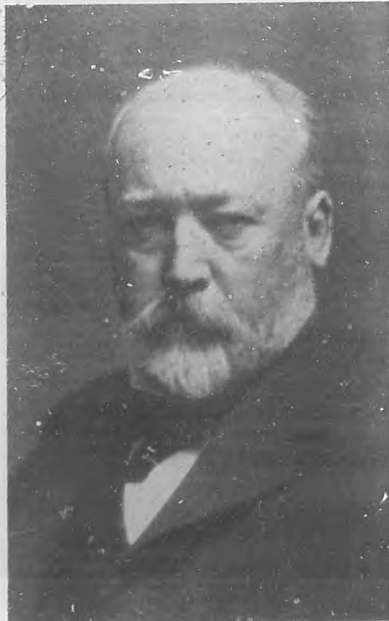
Sir William Van Horn K. C. M. G. Presidente de las Compañías The Cuba Co. y The Cuba Railroad Co.

La Exposición de Camagüey es una nota de cultura de la que debemos sentirnos orgullosos y a la que, amantes de todo cuanto signifique progreso, debemos prestar la mayor atención.