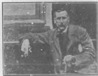
D. BENITO PÉREZ GALDÓS. Reproducción de un retrato del gran escritor español por Galdós.