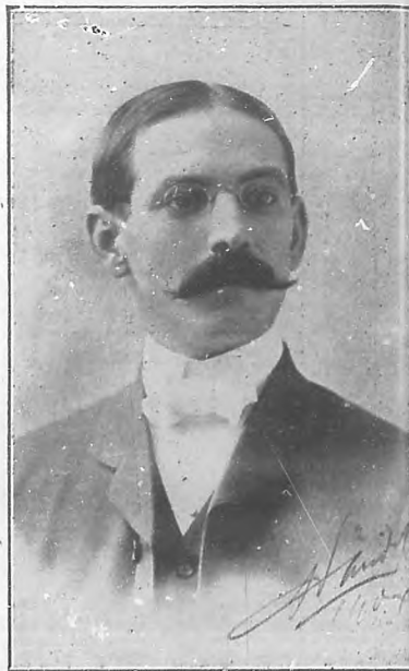
Francisco Rosado Presidente de la Comisión de Transporte.

Certámenes como el que en Camagüey se lleva a cabo son un exponente de vitalidad de una región; y en que cada una de las que constituyen la República progrese y adquiera importancia debe cifrarse la del país. Por eso, insistimos, actos como el que realiza Camagüey merecen la gratitud de todos los que amen a Cuba, y merecen apoyo y calor de todo buen ciudadano. ¡Ojalá el ejemplo cunda! Y ojalá que periódicamente cada región dé viril muestra de lo que es capaz en torneos semejantes al de Camagüey. Y como remate del esfuerzo de todas las regiones ojalá que cada lustro, por ejemplo, p